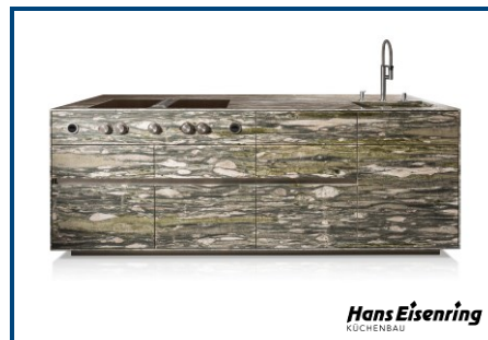
Naturstein-Kücheninsel ST-ONE® Kitchen island ST-ONE® with natural stone

Die Hans Eisenring AG war im Juli 2016 von der Stone Group AG aufgefordert worden, die Verwendung der Bezeichnung ST-ONE für eine Naturstein-Kücheninsel sowie die entsprechende Verwendung der Internet-Domain <st-one.ch> zu unterlassen. Die Stone Group AG ist Inhaberin zweier Wort-/Bildmarken; sie sah ihre Marken- und Firmenrechte verletzt und rügte zudem einen vermeintlich unlauteren Wettbewerb.